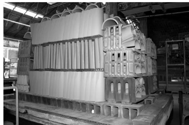
À gauche : mouleuse permettant la fabrication des petites tuiles spéciales. À droite : empilage de tuiles.