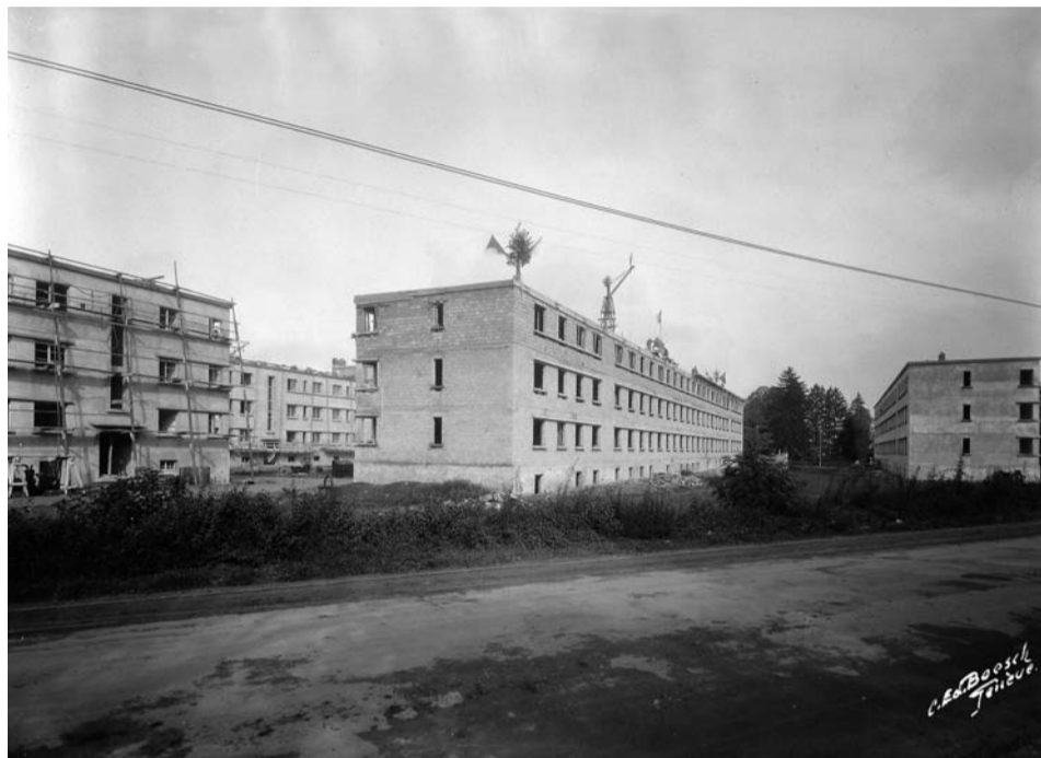
La cité-jardin en cours d'achèvement, vers 1930.

On voit alors sortir de terre cinq bâtiments de deux étages sur rez-de-chaussée excavé, ouverts sur un vaste espace de jeux, conçus par l'architecte Paul Perrin. Quatre d'entre eux sont affectés exclusivement au logement, tandis que le cinquième accueille également des magasins et, au début, deux classes d'école enfantine. À l'époque, les 108 appartements sont vantés comme offrant tout le « confort moderne » : chauffage central, « eau chaude à l'évier » et salles de bains. Ils étaient prévus pour 480 habitants qui bénéficiaient également de jardins potagers. « L'aspect extérieur de cette nouvelle cité-jardin