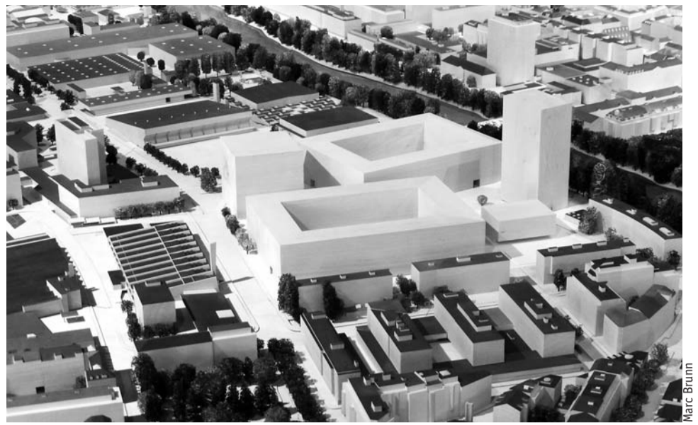
Le futur quartier des Vernets sur la maquette de la Ville de Genève.