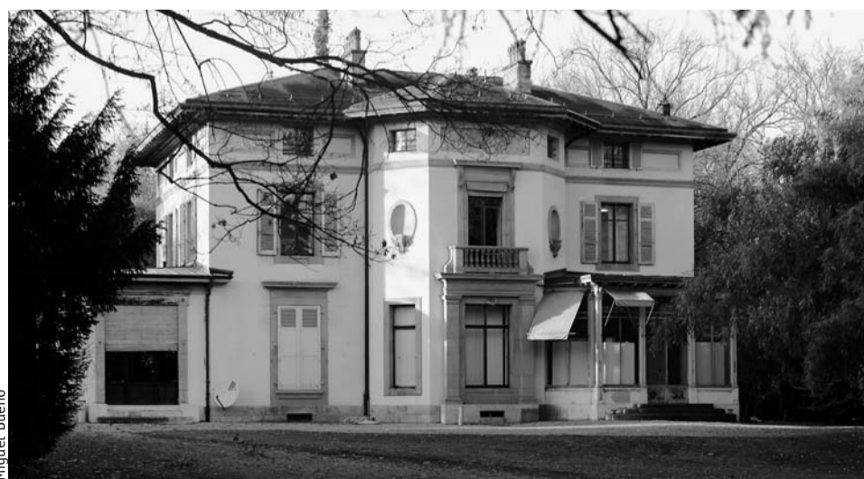
Villa Les Feuillantines.

En prenant ainsi position, Patrimoine suisse Genève répond à sa mission de sauvegarde du patrimoine bâti et paysager. Cependant, elle ne s'oppose pas au projet de création d'une Cité de la musique à Genève et elle encourage vivement la Fondation de la Cité de la musique à rechercher une solution alternative. Par ailleurs, et une fois encore, Patrimoine suisse